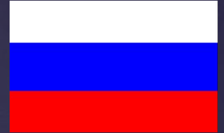
Флаг Российской империи

Российская империя во время её наибольшей внешней экспансии ( 1790 1790- 1860 ). Светло-зелёным цветом показана сфера русского влияния.