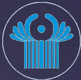
Флаг и эмблема СНГ

1991 г. – прекращение существования СССР, изменение политического устройства России, формирование новых суверенных государств из бывших республик СССР.