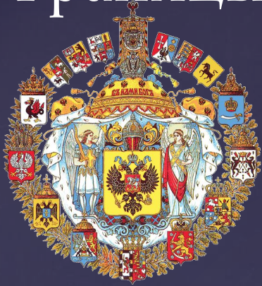
Большой герб Российской империи