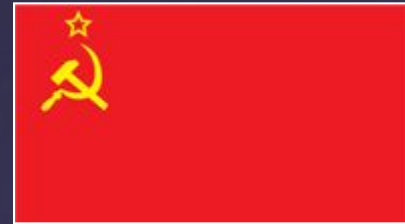
Флаг и герб СССР

1917 г. - Февральская и Октябрьская революции. Отречение от престола императора Николая II. Крах Российской империи и образование в 1922 г. СССР – Союза Советских Социалистических Республик (15 республик, в т.ч. РСФСР).