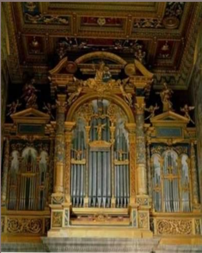
Орган 17 век в церкви Сан Джованни

Орган отливал серебром, Немой, как в руках ювелира, А издали слышался гром, Катившийся из-за полмира. Покоилась люстр тишина И в зареве их бездыханном Играл не орган, а стена, Украшенная органом. Ворочая балки, как слон, И, освобождаясь от брёвен,