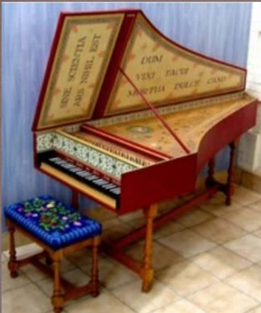
Клавесин XVII век