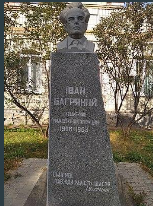
Погруддя Багряному в Охтирці