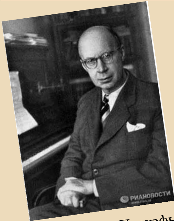
Композитор С. Прокофьев

Кантата (итал. cantata , от лат. cantare — петь) — вокально-инструментальное произведение для солистов, хора и оркестра.