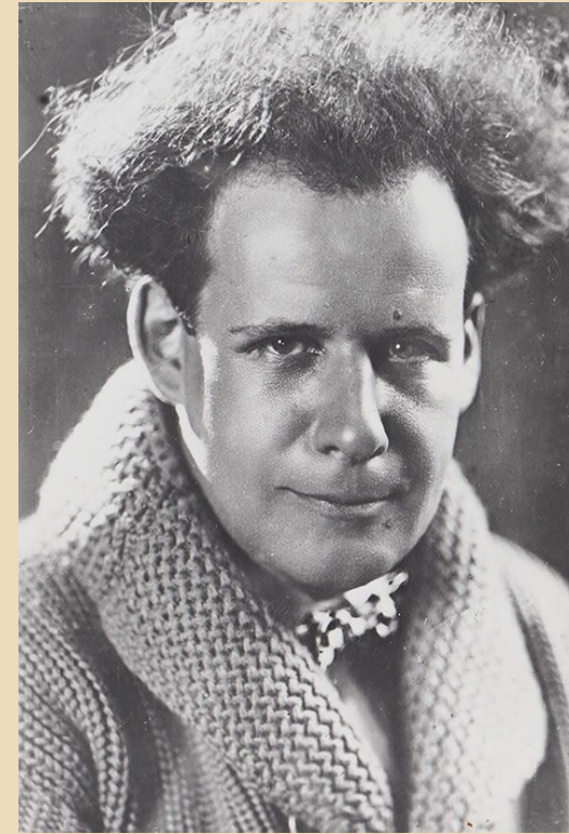
Режиссер С. Эйзенштейн

Вставайте, люди русские, На славный бой, на смертный бой, Вставайте, люди вольные, За нашу землю честную!