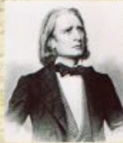
Ференц Лист 1811 – 1886 венгерский композитор