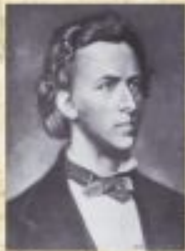
Фредерик Шопен 1810 – 1849 польский композитор

Оба они были прекрасными пианистами. Шопен завоевал признание слушателей в светских салонах, а Лист – в больших концертных залах.