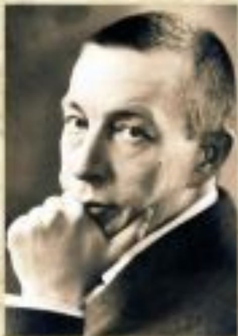
С.В.Рахманинов 1873 – 1943

Значительным достижением в развитии жанра являются этюды русских композиторов.