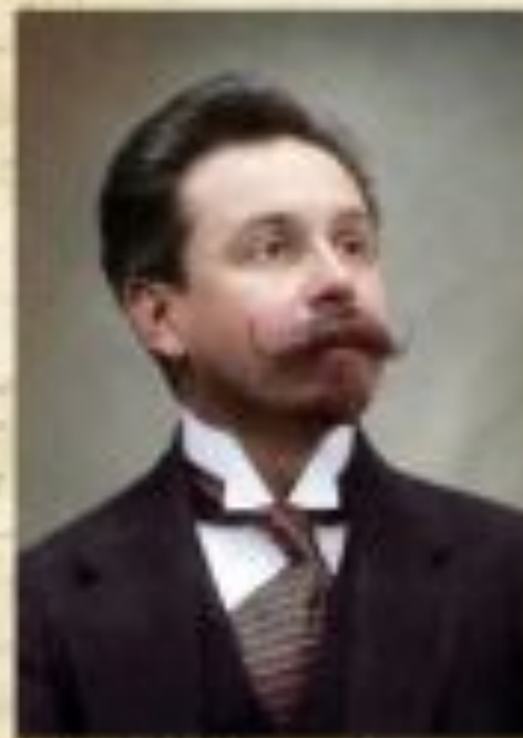
А.Н.Скрябин 1872 - 1915