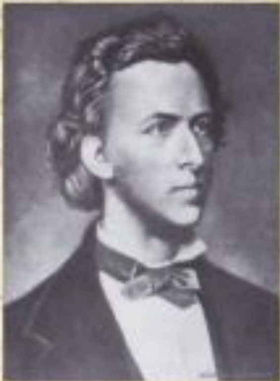
Фредерик Шопен 1810 – 1849 польский композитор

В этюдах Ф.Шопена звучит романтическая мечта о чувствах, возвышающих человека, - это мысли о любви, и созерцание природы, и революционный пафос.