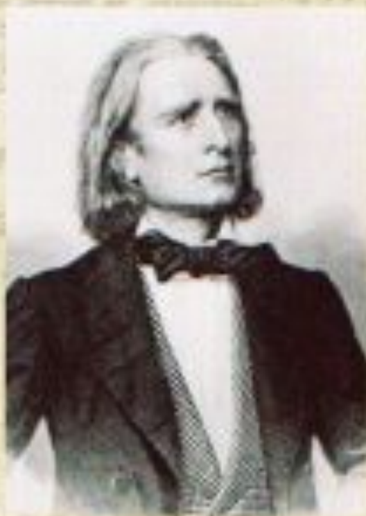
Ференц Лист 1811 – 1886 венгерский композитор

Ф.Лист стремился приблизить звучание фортепиано к звучанию оркестра. В его этюдах заложены принципы программности, образно-живописной манеры изображения.