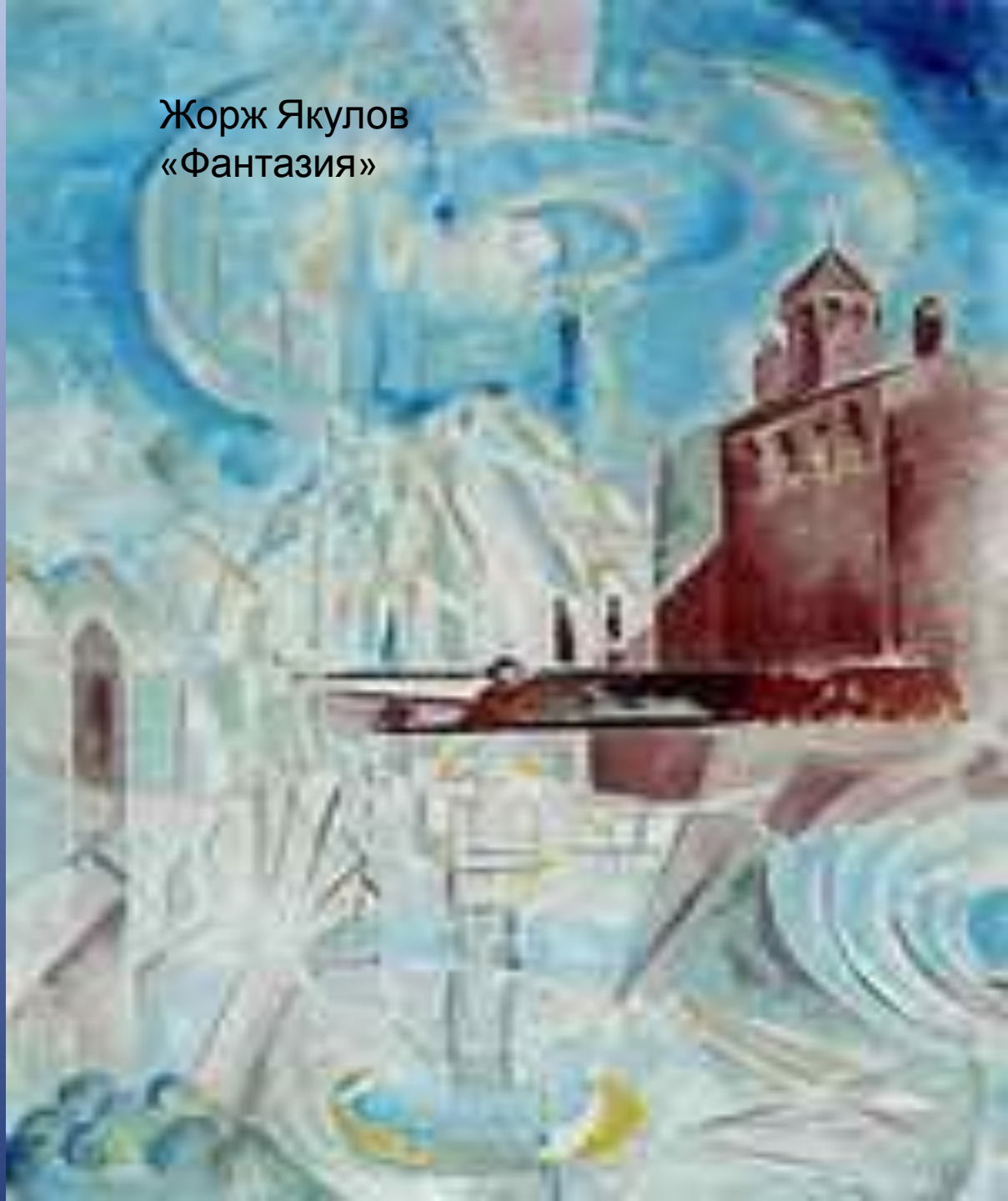
Жорж Якулов «Фантазия»

Имажини́зм (от лат. imago — образ) — литературное направление в русской поэзии XX века, представители которого заявляли, что цель творчества состоит в создании образа. Основное выразительное средство имажинистов — метафора, часто метафорические цепи, сопоставляющие различные элементы двух образов — прямого и переносного. Для творческой практики имажинистов характерен эпатаж, анархические мотивы.