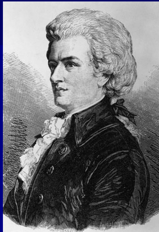
Моцарт Вольфганг Амадей