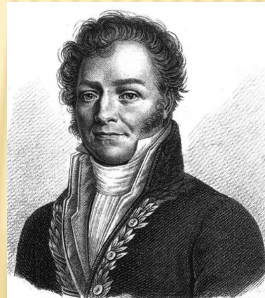
Луи Жак Тенар