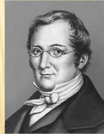
Жозеф Луи Гей Люссак