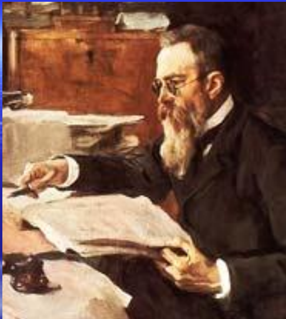
Портрет работы Серова

Открытый урок Красота природы и правда отображения ее в музыке 6классы