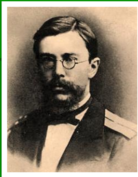
Н.А. Римский - Корсаков