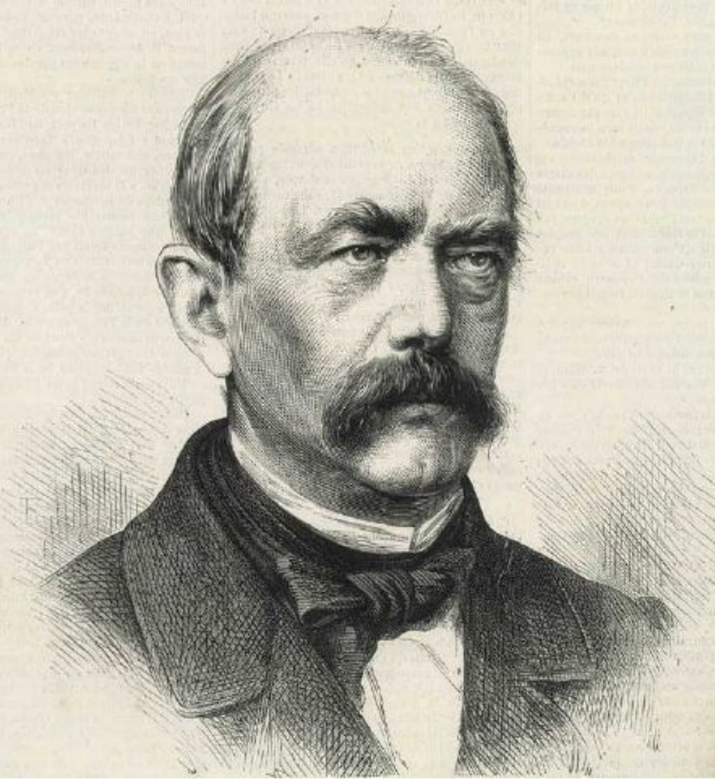
Бисмарк в 1870 г