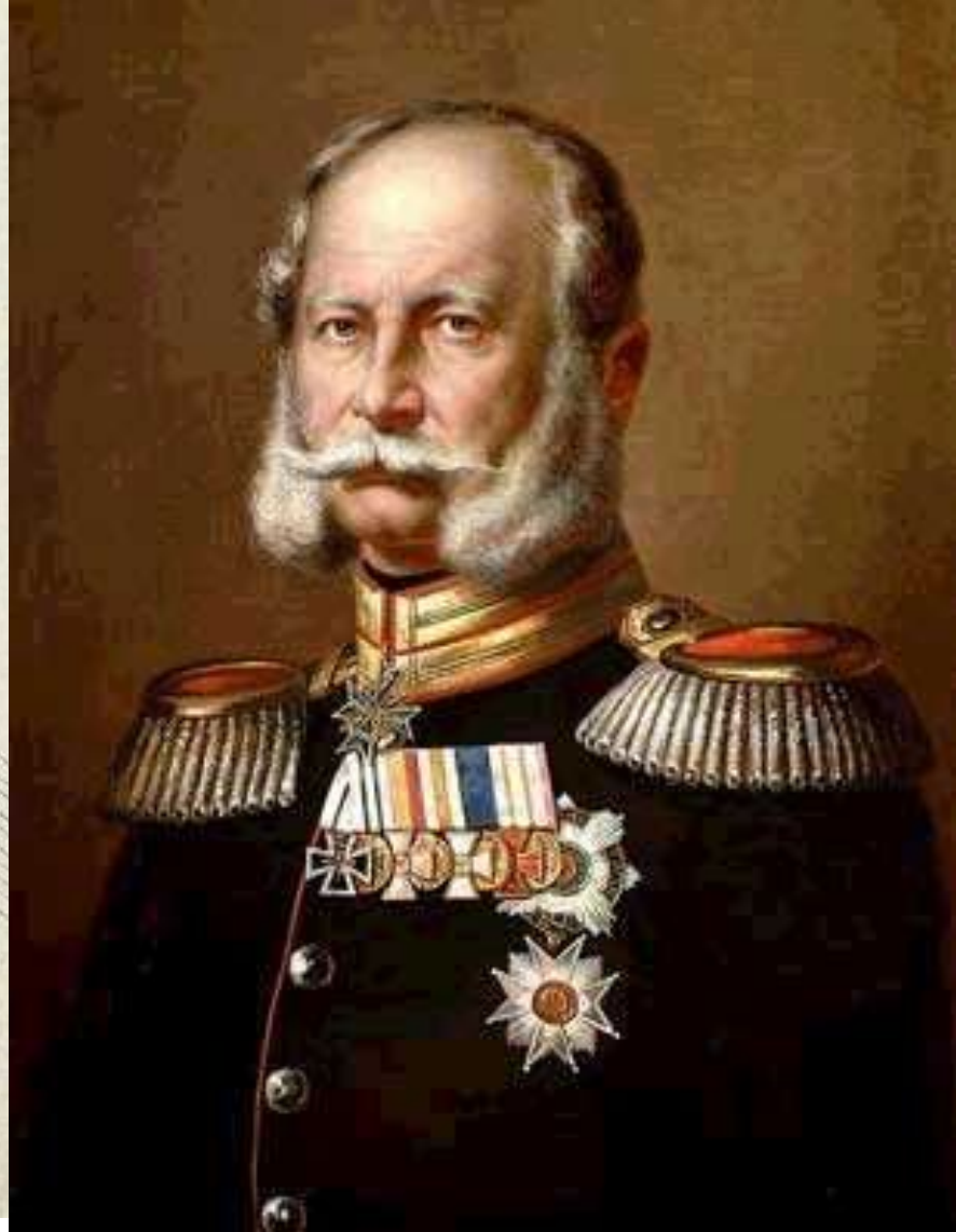
Кайзер Вильгельм I