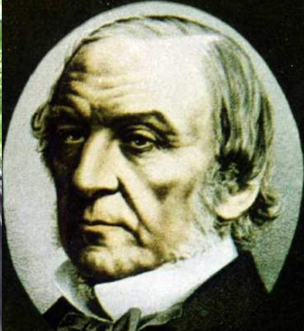
У. Гладстон, лидер либералов