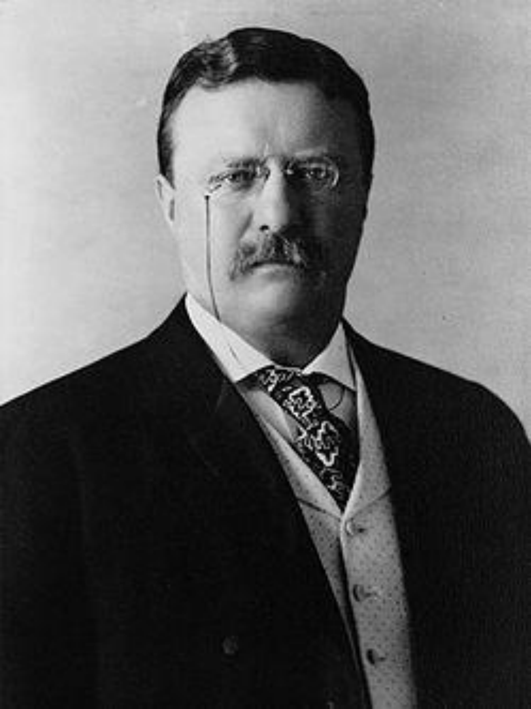
Теодор Рузвельт 26-й президент США 1901-1909 гг.