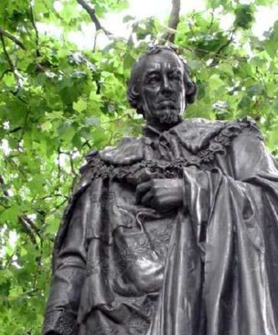
Б. Дизраэли, лидер консерваторов