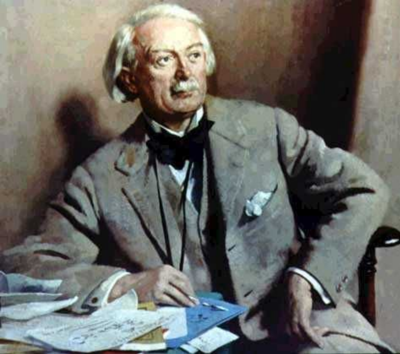
Д. Ллойд-Джордж (либерал)