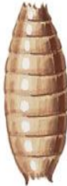
скрытая у мухи