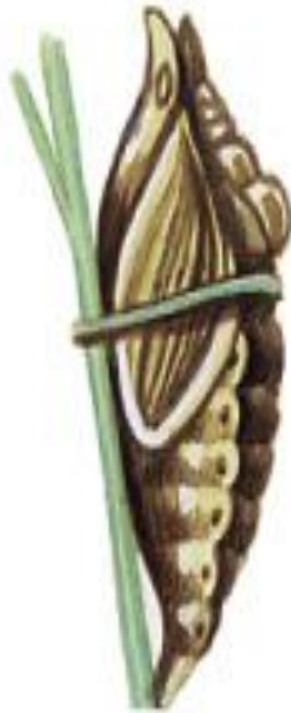
покрытая у бабочки