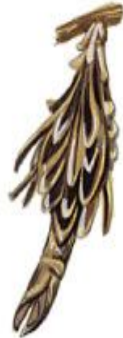
в коконе у бабочки