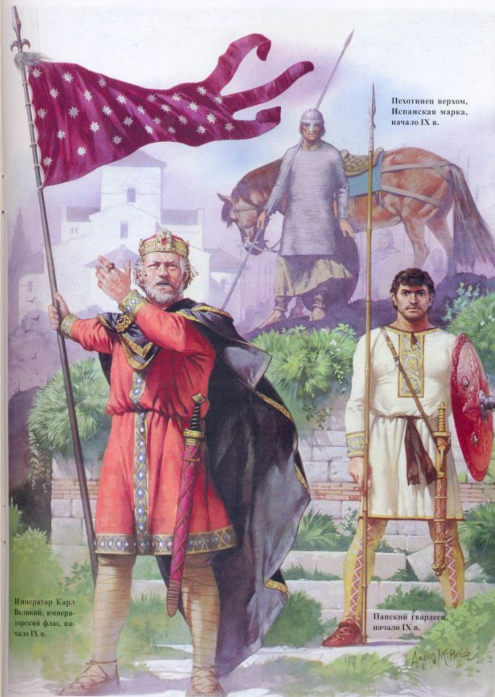
Пехотинец верхом, Испанская марка, начало IX в.

Каролинги очень хотели, чтобы ни у кого не оставалось сомнений в их законном праве владеть престолом.