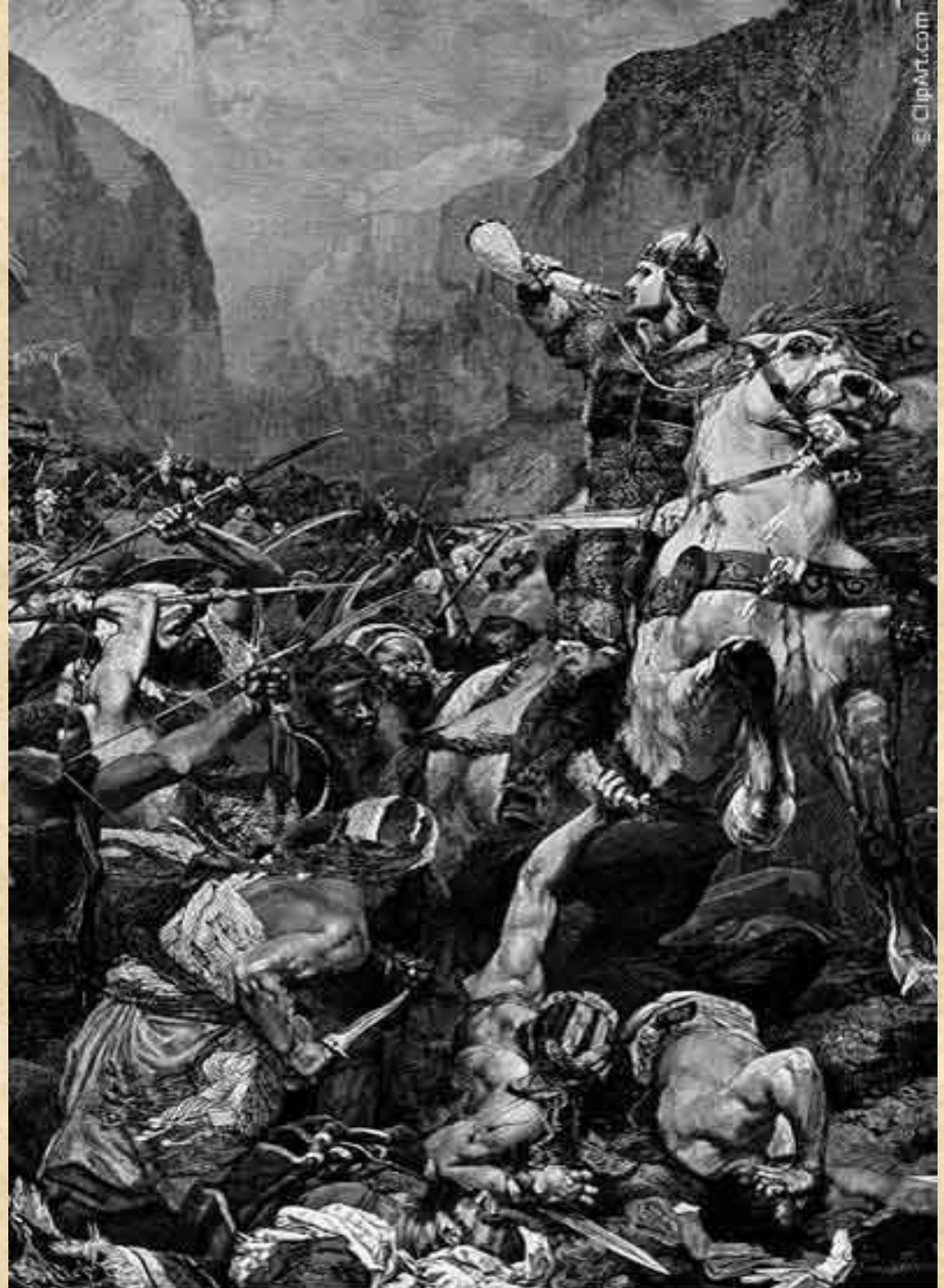
Roland, nephew of Charlemagne, Blowing the Horn

Две трети своего долгого правления — а это без малого 50 лет (768—814) — он провел в походах и сражениях, отвоевывая у соседей все новые и новые земли