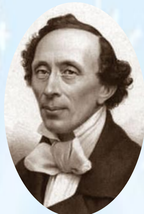
Ханс Христиан Андерсен