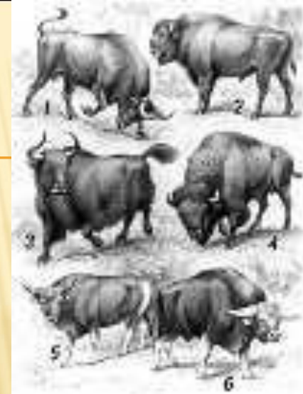
1 - тур; 2 - зубр; 3 - як; 4 - бизон; 5 - бантенг; 6 - гаял

Впервые это направление в природоохранной деятельности предложил и разработал профессор Борис Николаевич Вепринцев . Им в 1978 году на XIV Генеральной Ассамблее МСОП был сделан доклад, который обратил на себя внимание ученых. Было решено организовать Рабочую группу по сохранению генома . Консервация генома призвана дополнить другие способы сохранения генетической информации.