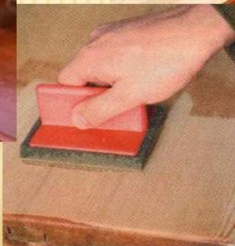
На плоскую поверхность наносите морилку малярным тампоном