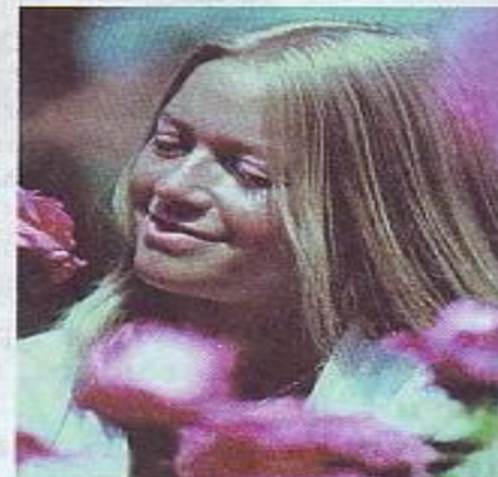
Рис. 117. Представители негроидной, монголоидной и европеоидной рас