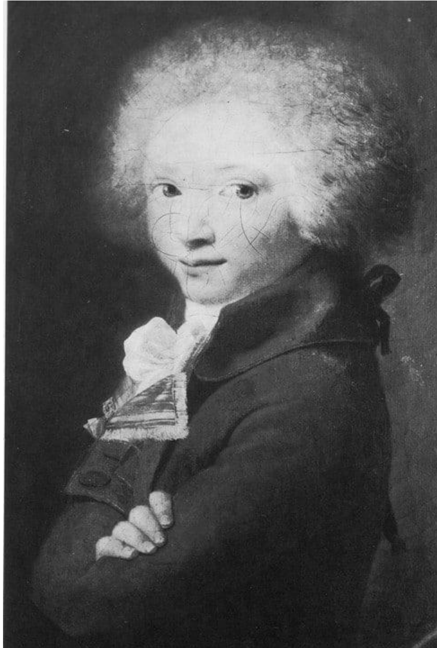
Портрет М.В. Ломоносова в детстве