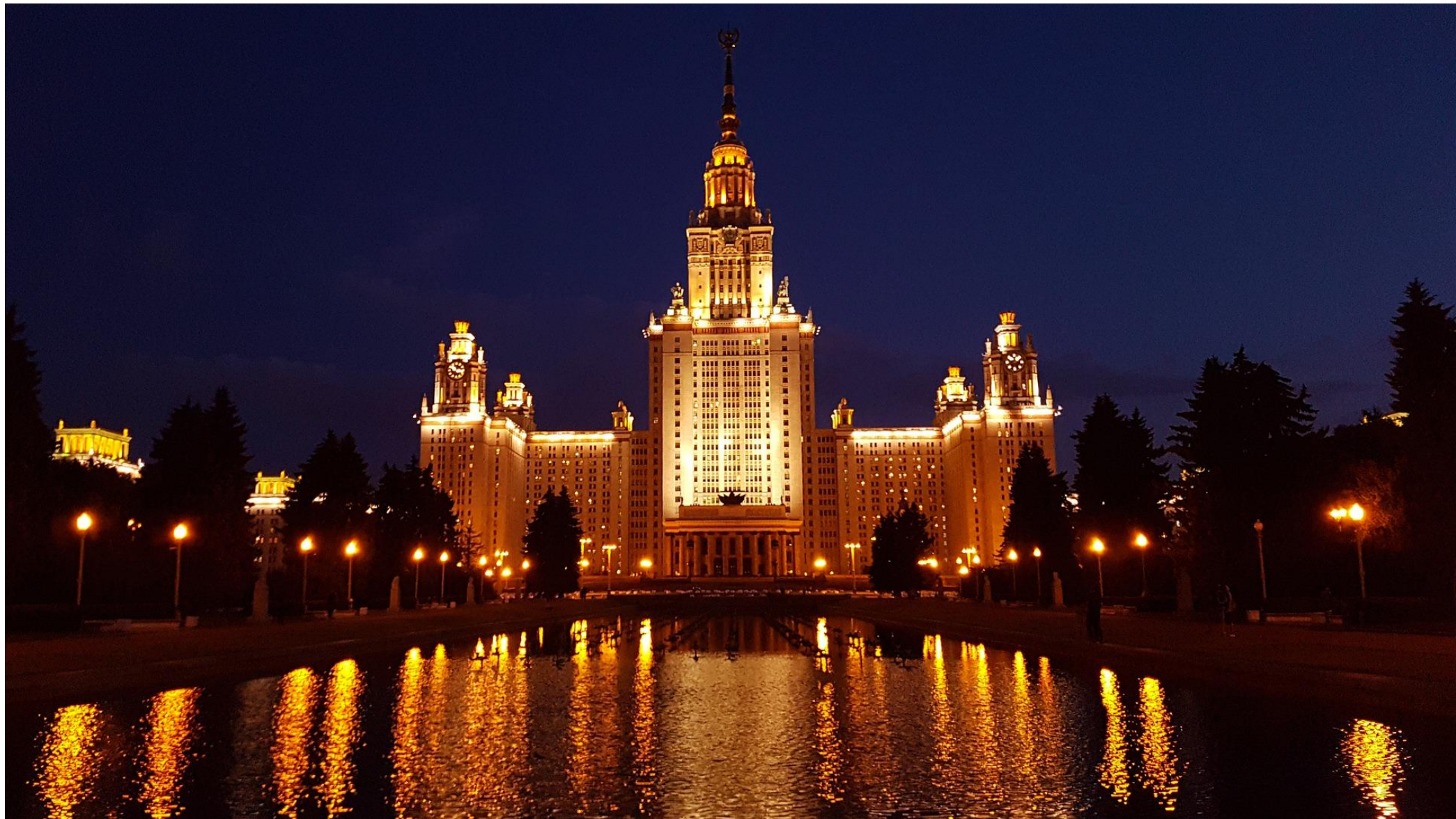
МГУ. Университет Ломоносова.