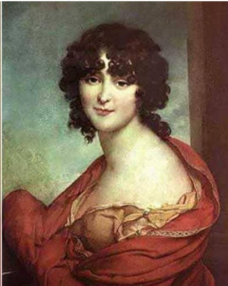
М.В. Ломоносов и Елизавета Цильх