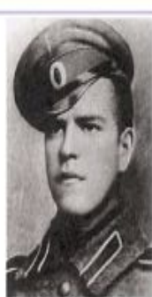
Унтер-офицер Георгий Жуков, 1916 год.