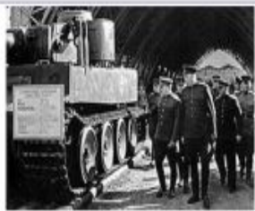
Г. К. Жуков и К. Е. Ворошилов осматривают захваченный немецкий танк «Тигр», 1943 год.