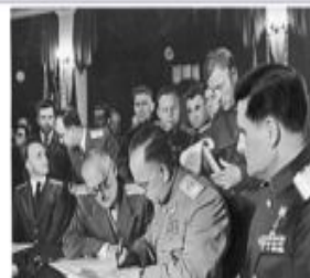
Подписания Акта о безоговорочной капитуляции Германии 8 мая 1945 года в 22:43 по центральноевропейскому времени (9 мая 0:43 по московскому времени), Карлсхорст (Берлин).