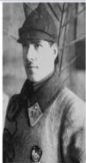
Командир 39-го Бузулукского кавалерийского полка Г. К. Жуков. 1923 год.