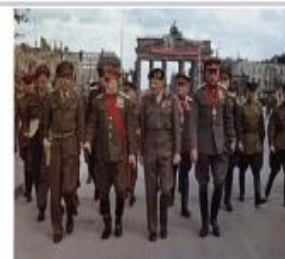
12 июля 1945 года фельдмаршал Монتماгери возложил на маршала Жукова Большой Крест рыцаря ордена Бани военного класса (Берлин, у Брандербургских ворот)