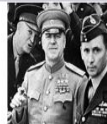
Жуков на церемонии вручения ордена «Победы» Дуайту Эйзенхауэру 5 июня 1945, Франкфурт. Слева направо: Эйзенхауэр, Жуков, Артур Уильям Теддер