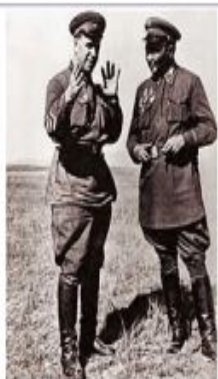
Жуков и Маршал Чойбалсан, Халхин-Гол.