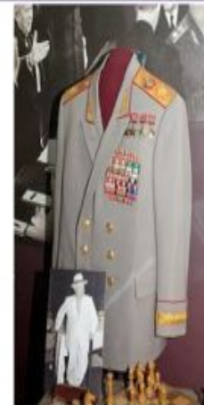
Мундир Г. К. Жукова в Государственном музее политической истории России.