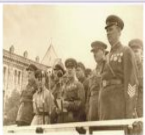
Командующий КОВО Г. К. Жуков на митинге в Кишинёве, июнь 1940 г.