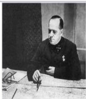
Жуков в октябре 1941. Фото из газеты «Красная звезда», опубликовано по личному указанию Сталина.