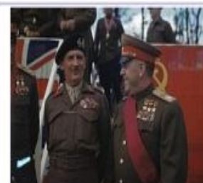
Берлин, 12 июля 1945 г. Жуков с фельдмаршалом Монتماгери.