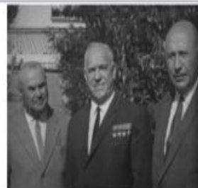
Н. А. Антипенко, Г. К. Жуков и И. Х. Баграмян.