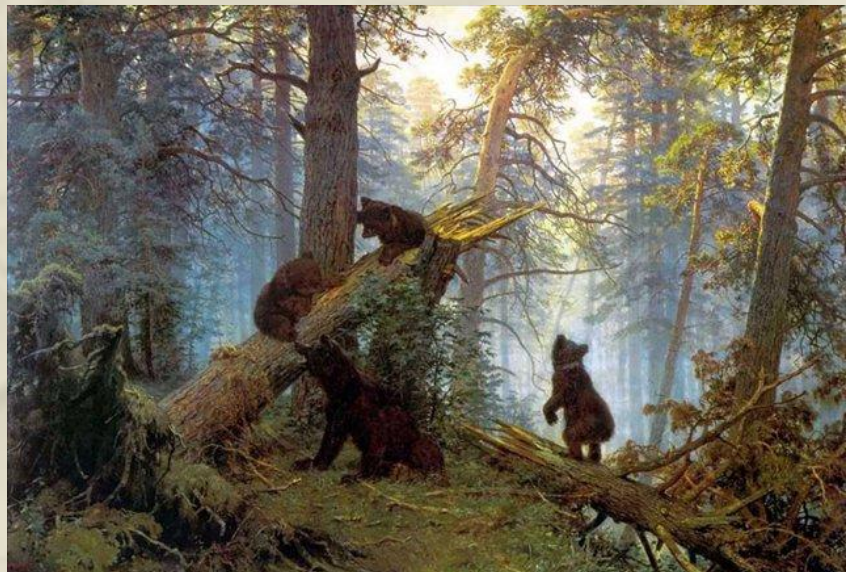
И. И. ШИШКИН «УТРО В СОСНОВОМ ЛЕСУ»

Проснулись обитатели чащи – три медвежонка и медведица. Похоже, малыши сыты и довольны. Они беззаботно и неуклюже возятся на сломанном стволе упавшей сосны, а медведица внимательно наблюдает за их игрой, чутко реагируя на шорохи пробуждающегося леса. Могучая сосна, которую ураган когда-то выдернул с корнем, и медвежье семейство, резвящееся на нем, - все это рождает у нас ощущение глухости и отдаленности этого уголка дикой природы.