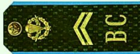
Младший сержант (ВДВ)