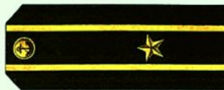
Капитан 3 ранга (повседневная форма одежды)