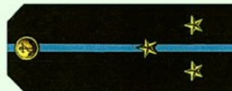
Старший лейтенант (повседневная форма одежды, морская авиация)