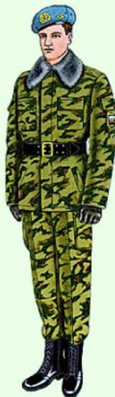
Парадная для строя в ВДВ