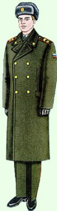
Парадная вне строя