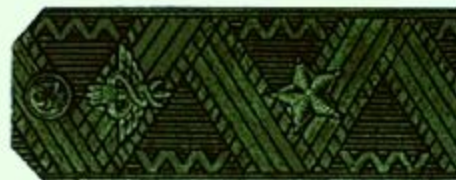
Генерал-майор (полевая форма одежды)