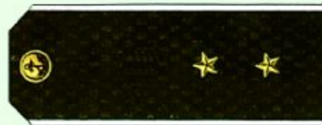
Мичман (повседневная форма одежды, ВМФ)