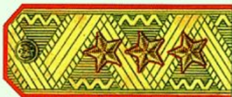
Генерал-полковник (парадная форма одежды)