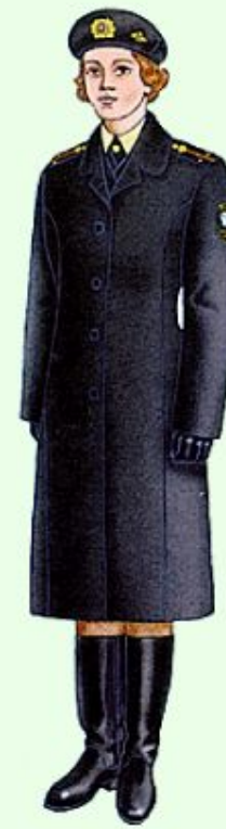
Зимняя повседневная вне строя в береговых войсках ВМФ