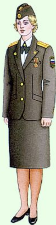
Летняя парадная для строя и вне строя (кроме ВМФ)