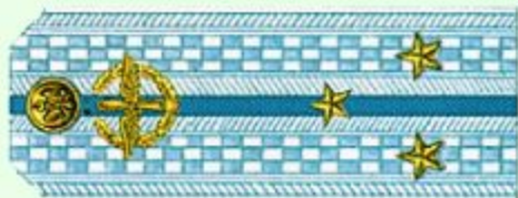
Старший лейтенант (парадная форма одежды, ВВС)