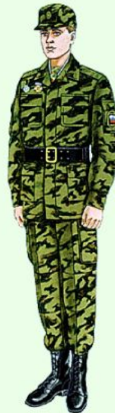
Повседневная для строя и вне строя