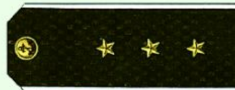
Старший мичман (повседная форма одежды, ВМФ)