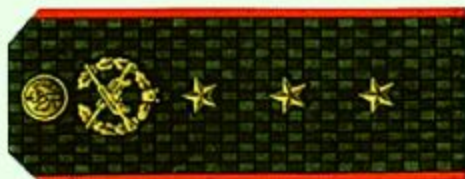
Старший прапорщик (повседневная форма одежды)