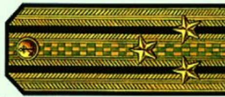
Капитан 1 ранга (парадная форма одежды)