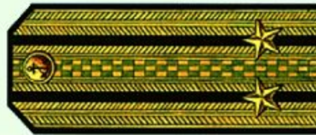
Капитан 2 ранга (парадная форма одежды)