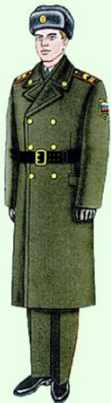
Парадная для строя