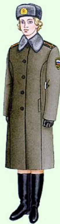
Зимняя повседневная вне строя (кроме ВМФ)