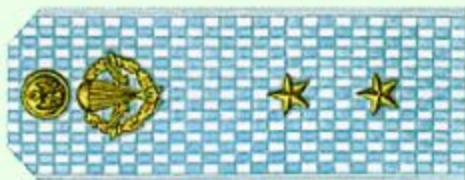
Прапорщик (парадная форма одежды, ВДВ)