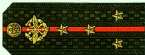
Капитан (повседневная форма одежды)