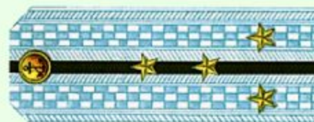
Капитан-лейтенант (парадная форма одежды, ВМФ)