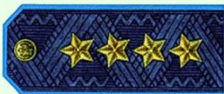
Генерал армии (парадная форма одежды, ВС)