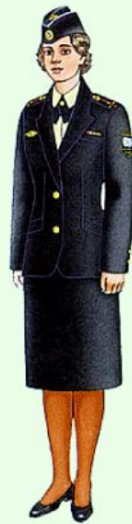
Летняя повседневная вне строя в ВМФ