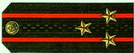
Полковник (повседневная форма одежды)