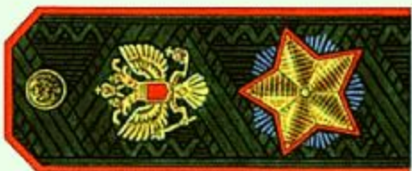
Маршал Российской Федерации (повседневная форма одежды)