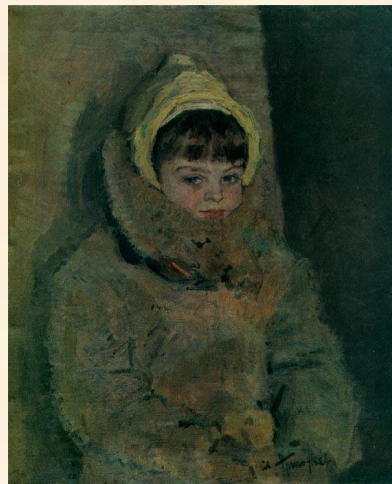
Девочка в шубке