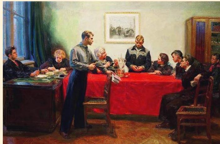
Приём в комсомол