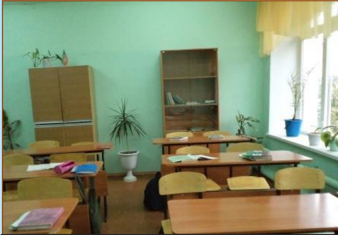
Балаларның сэламэтлеге өчен мәктәптә бөтен шартлар булдырылган