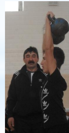
Иң көчле гер күтөрүчеләр - бездә