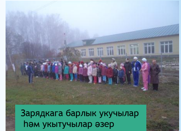
Зарядкага барлык укучылар һәм укытучылар әзер

Иртә торыйк, Житез булыйк, Без иренмик бер дә. 1,3,3, физзарядканы Йөгерүдән башлыйк, әйдәгез бергә.