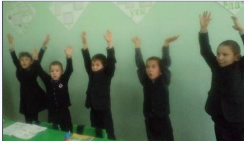
Дәресләрдә физминутка ясыйбыз