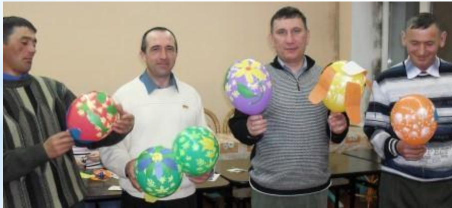
«Путь к успеху» программасы буенча эти - әниләр белән эш