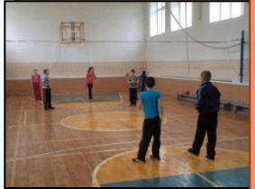
Дәрестә, тәнәфестә Без гел хәрәкәттә