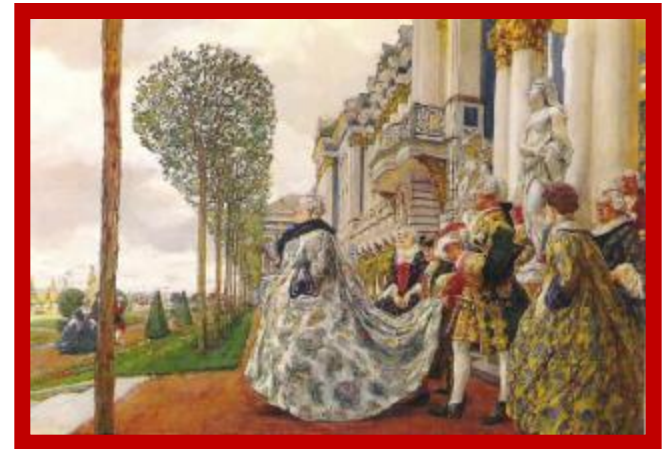
Императрица Елизавета Петровна в Царском Селе Е. Е. Лансере