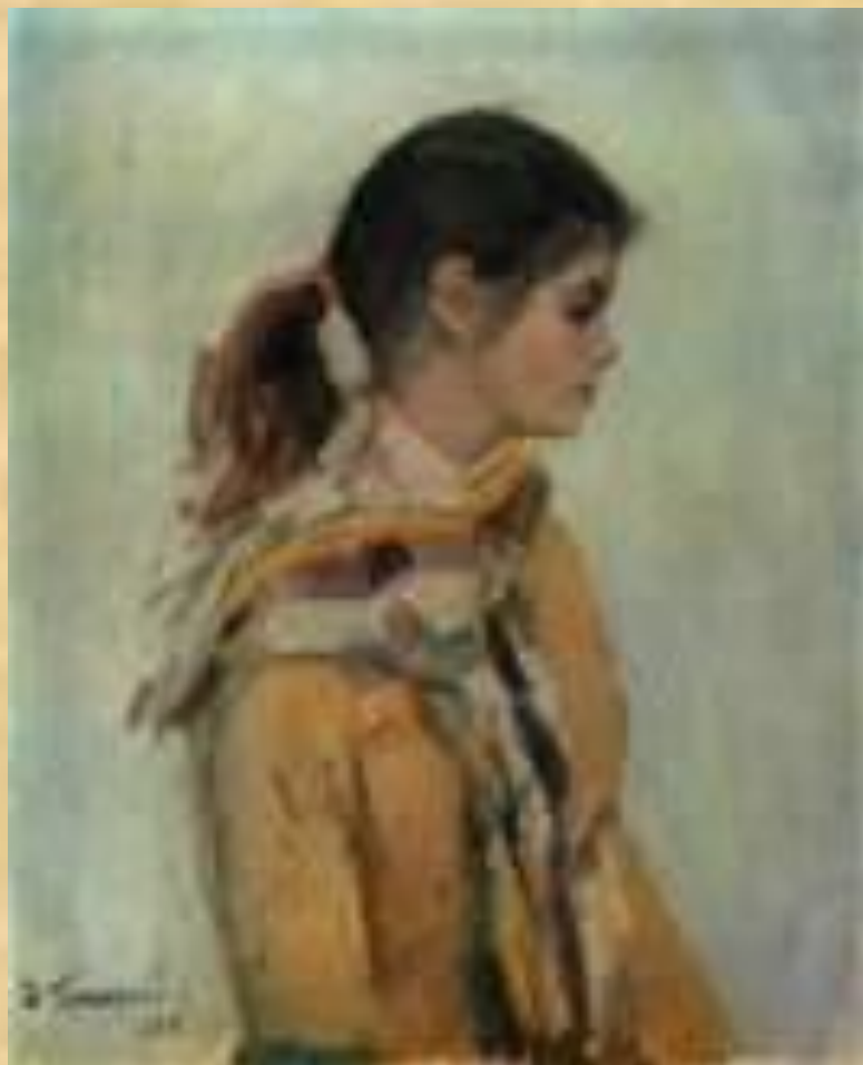
«ВНУЧКА ПОЭТА» ЯБЛОКОМ»