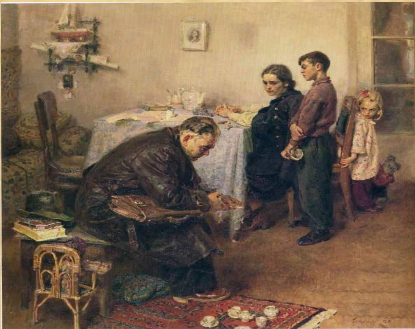
344 Sergei A. Grigorev, He's come back , 1954. Oil on canvas, 130 × 140 cm (51 × 55 in.). Tretyakov Gallery, Moscow.