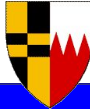
Герб замужней женщины