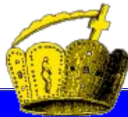
Корона Карла Великого