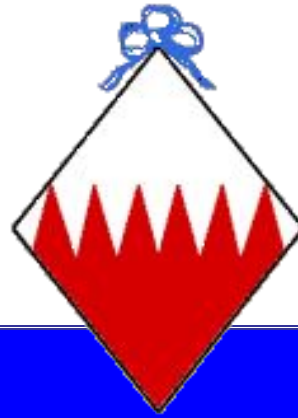
Герб незамужней женщины