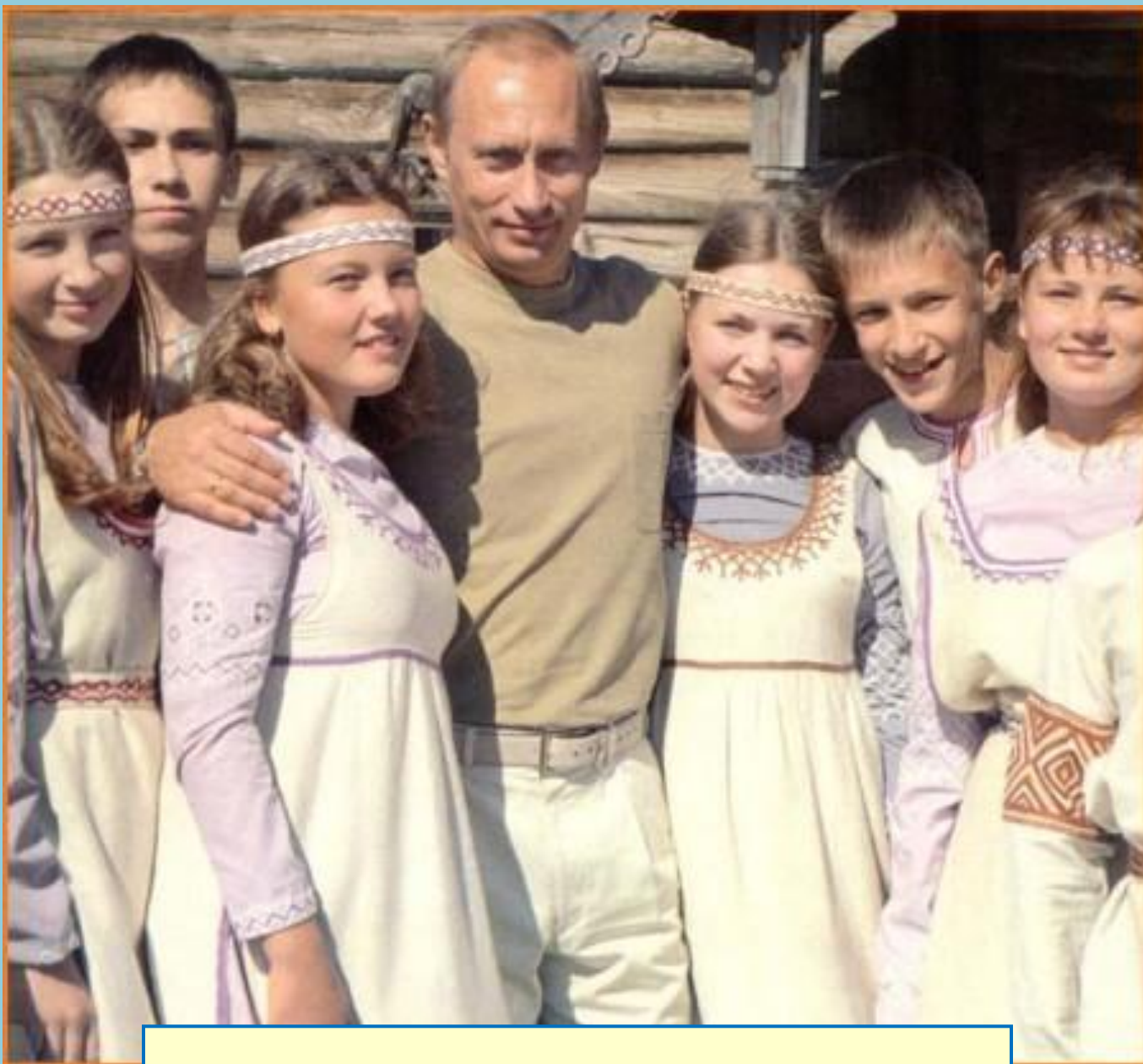
Организация «Дети России»