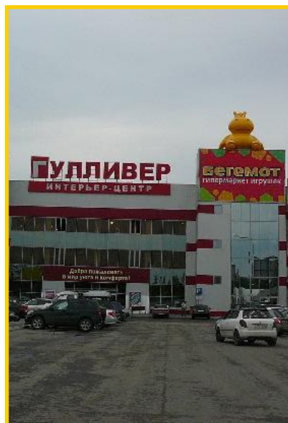
«Бе́гемот» г. Сургут