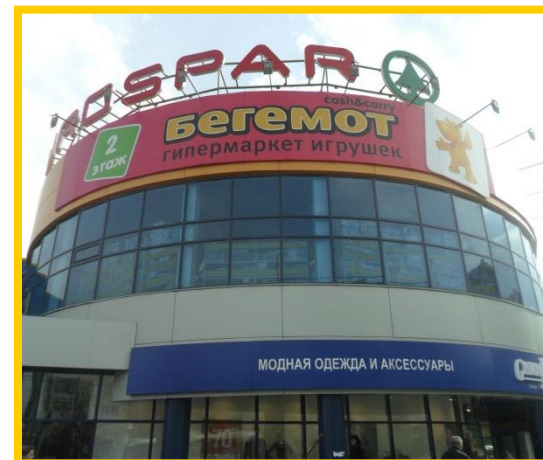
«Бе́гемот» г. Саранск