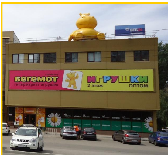
«Бе́гемот» г. Тольятти

Наличие яркой заметной вывески на фасаде здания – обязательное условие открытия гипермаркета «Бегемот» в любом торговом центре.