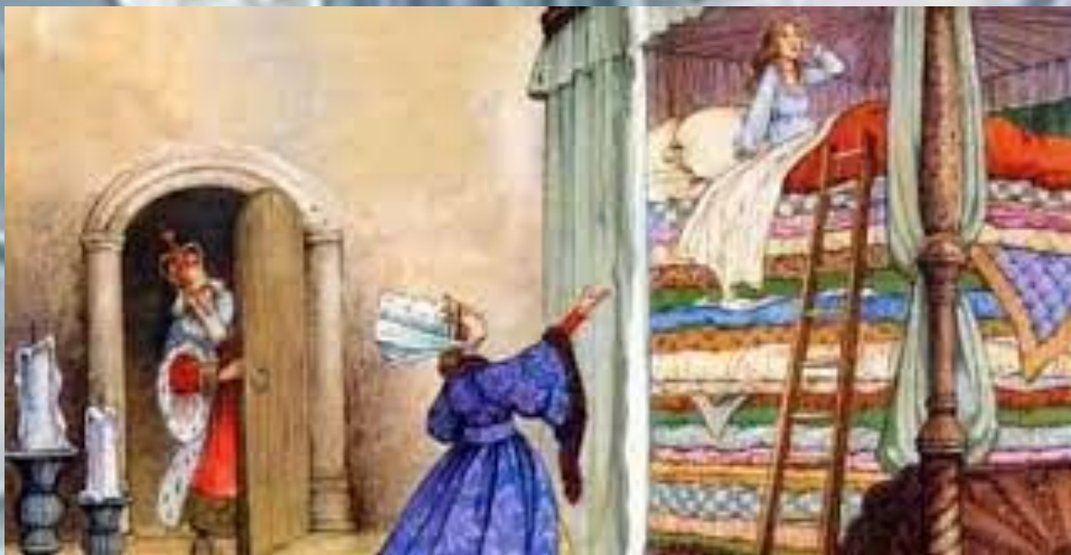
Принцеса на горошині