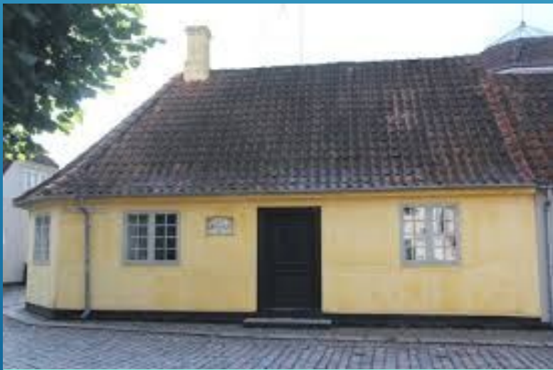
Будинок, у якому народився Г.-К. Андерсен (нині Музей Г.-К. Андерсена). м. Оденсе (Данія).

Родина Андерсенів мешкала в бідному районі міста. Мама Ганса Крістіана була пралею, а тато — чоботарем. Сім'я потерпала від злиднів, однак у хлопчика завжди були іграшки, які майстрував батько. Батько, незважаючи на свій фах, був людиною начитаною і свою любов до книги зумів передати Гансу Крістіану. Ганс Крістіан ріс великим мрійником і фантазером.. У 1816 році батько, отримавши поранення на війні, помер, і хлопчику довелося шукати роботу. Так він опинився у Копенгагені. Від матері Ганс-Крістіан успадкував чудовий голос, також мав талант декламувати й ставити п'єси. Завдяки природним здібностям йому вдалося отримати роботу в Королівському театрі. Великим актором він не став, але саме тоді почав писати вірші й драматичні твори.