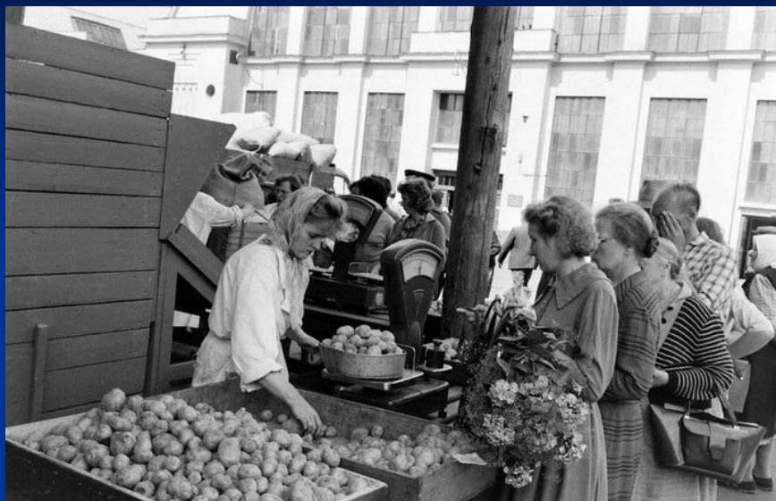
СССР, Москва, очередь за продуктами.