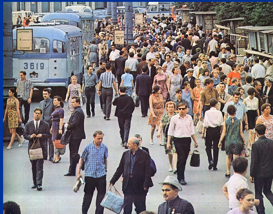
СССР, Москва, городская суета 60-х .