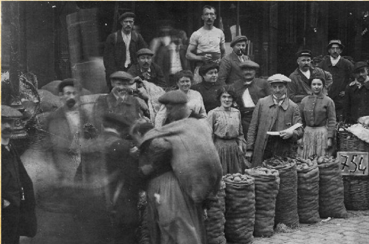
Рынок в Германии в период экономического кризиса.