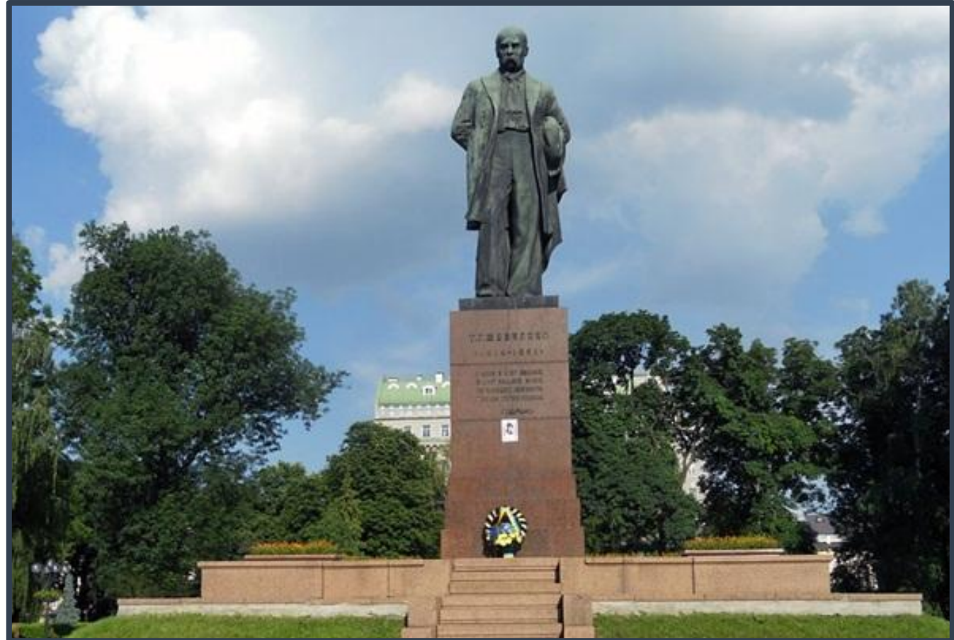
Пам'ятник Тарасові Шевченку у Києві — пам'ятник українському поету і художнику Тарасові Шевченку у Києві, що знаходиться у парку Шевченка.