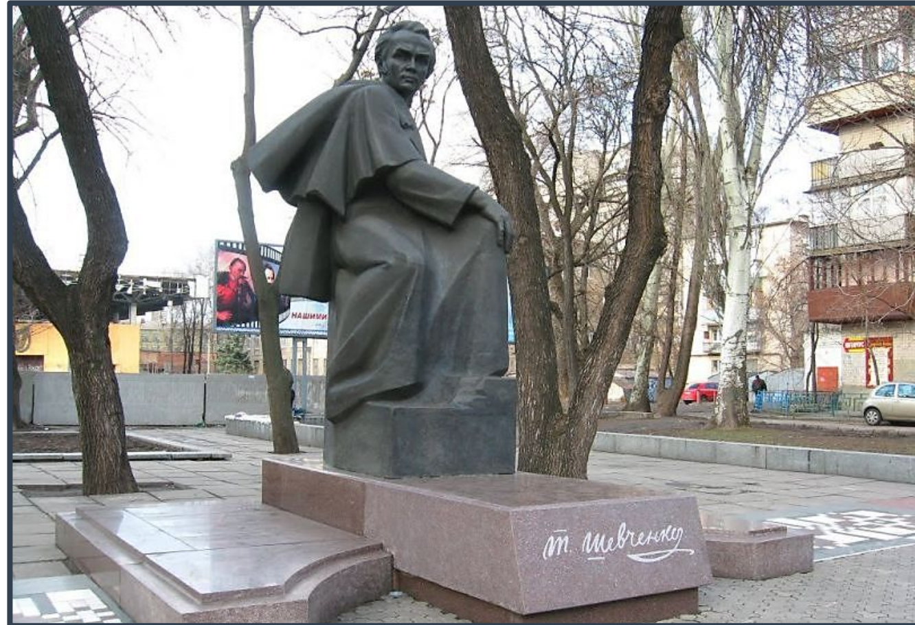
Пам'ятник молодому Тарасу Шевченку — скульптурна композиція у Дніпрі, присвячена Тарасу Шевченку.