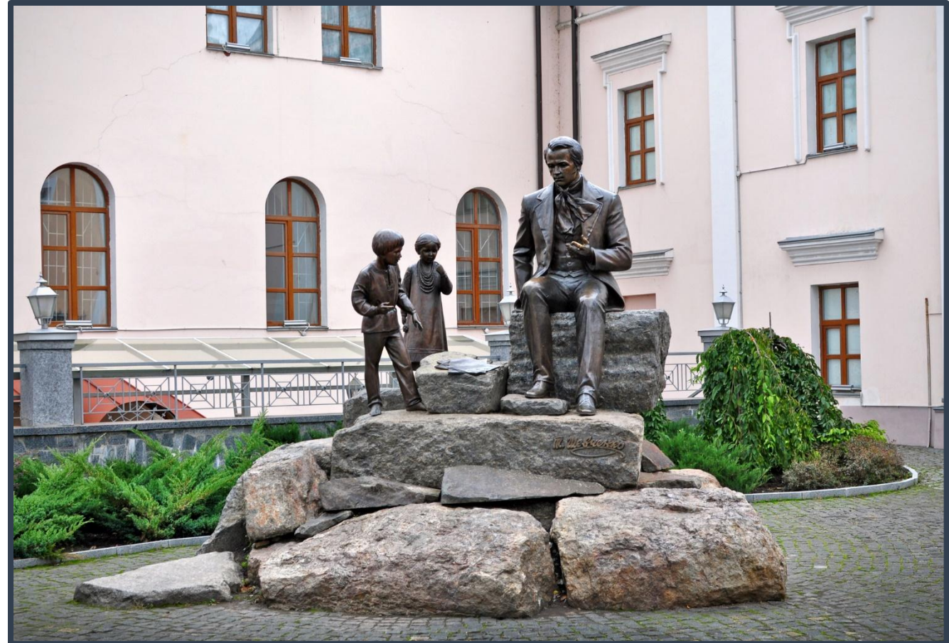
Пам'ятник молодому Тарасу Шевченку — скульптурна композиція у Вінниці, присвячена Тарасу Шевченку.