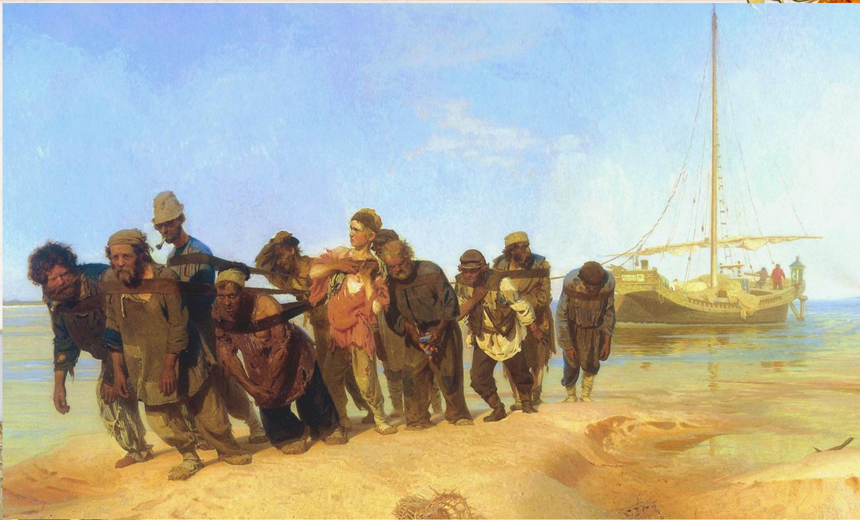
И.Репин «Бурлаки на Волге»