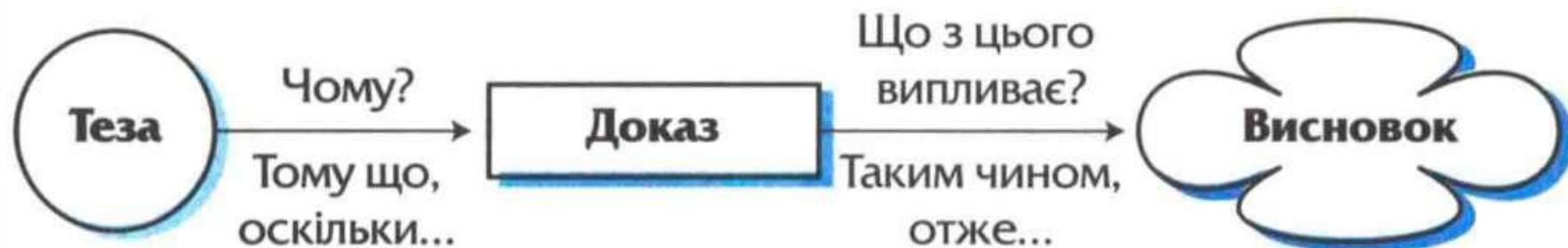
СХЕМА СТЯГНЕНОГО РОЗДУМУ