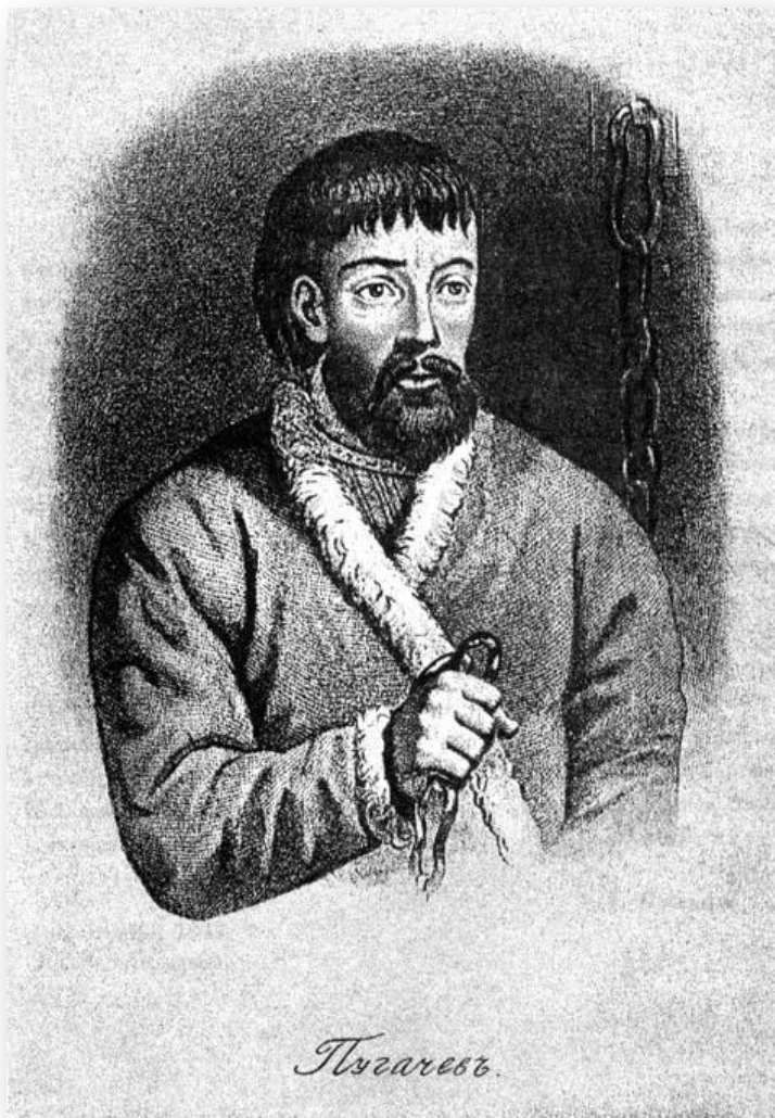
Емельян Пугачёв. Портрет, приложенный к изданию «Истории пугачёвского бунта» А. С. Пушкина, 1834

Крестьянская война Пугачева кратко может быть охарактеризована как массовое народное восстание, сотрясавшее Российскую империю с 1773 по 1775 годы. Волнения происходили на огромных территориях, включающих Урал, Поволжье, Башкирию и Оренбургский край. Лидером восстания выступил Емельян Пугачев – донской казак, объявивший себя императором Петром III.