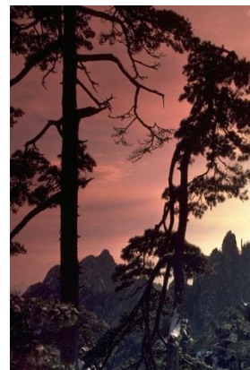
Иллюстрации И. Л. Бруни