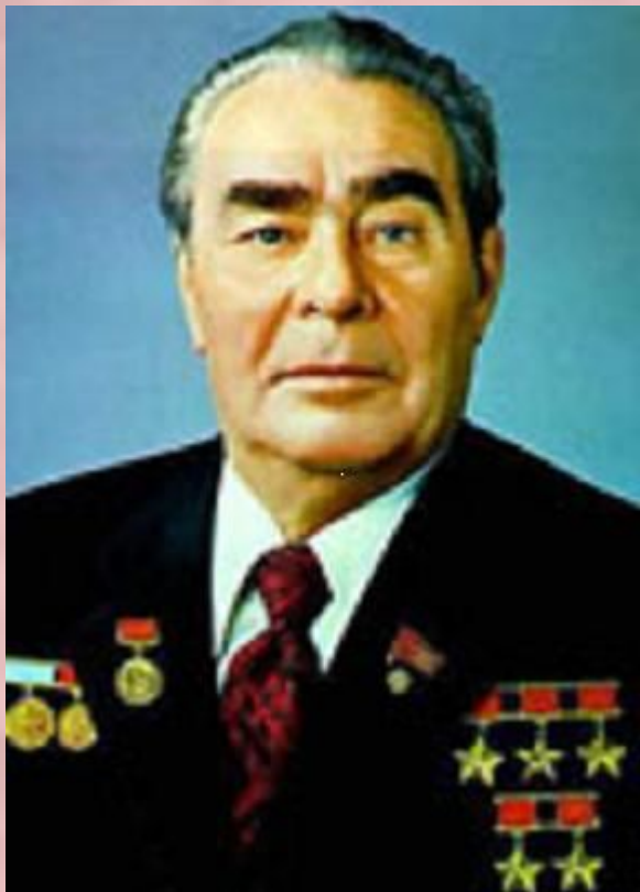
Л.И.Брежнев 1964-1982г ноябрь