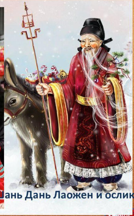
Шань Дань Лаожен и ослик

Жители Поднебесной тоже имеют свое национальное достояние в виде Деда Мороза, имен у которого сразу несколько: Дун Че Лао Рен, Шо Хин или Шань Дань Лаожен.