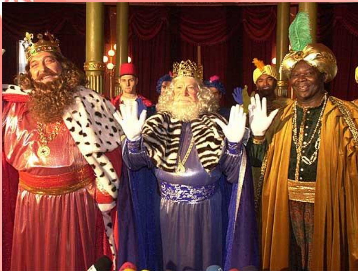
Новогодние короли-волшебники – Бальтасар, Гаспар и Мельчор