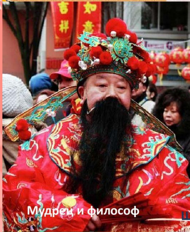
Мудрец и философ