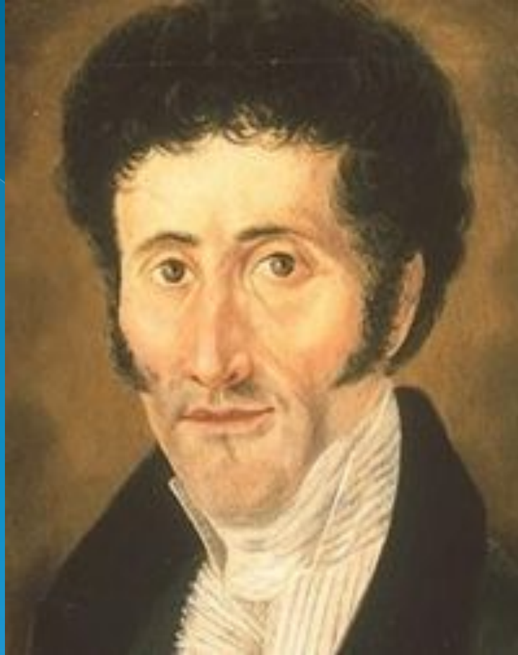
Гофман Эрнст Теодор Амадей