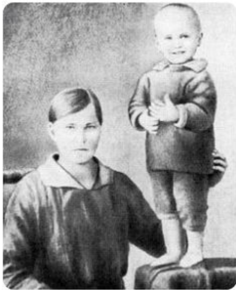
Вася Шукшин с мамой