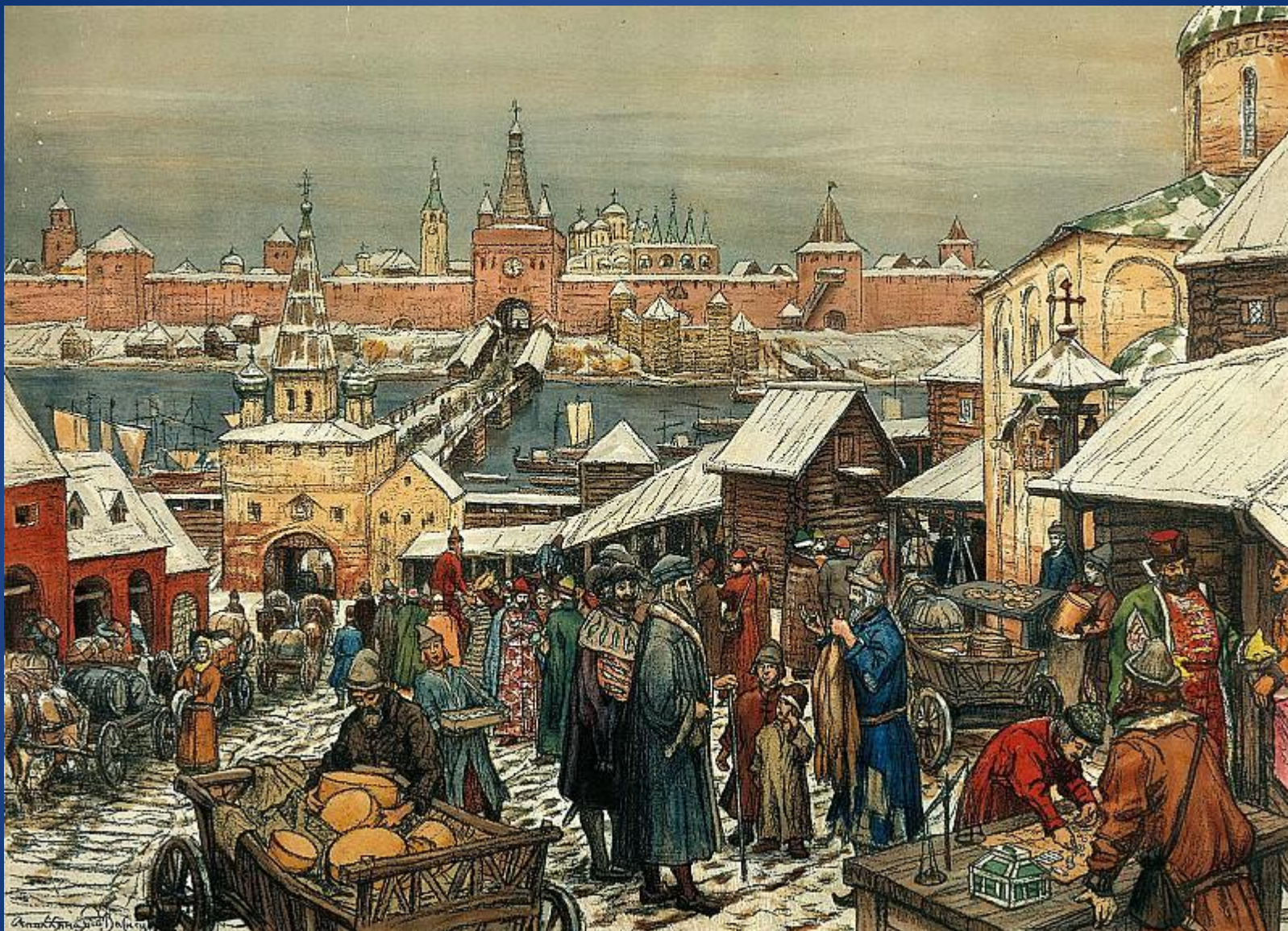
Аполлинарий ВАСНЕЦОВ - Новгородский торг