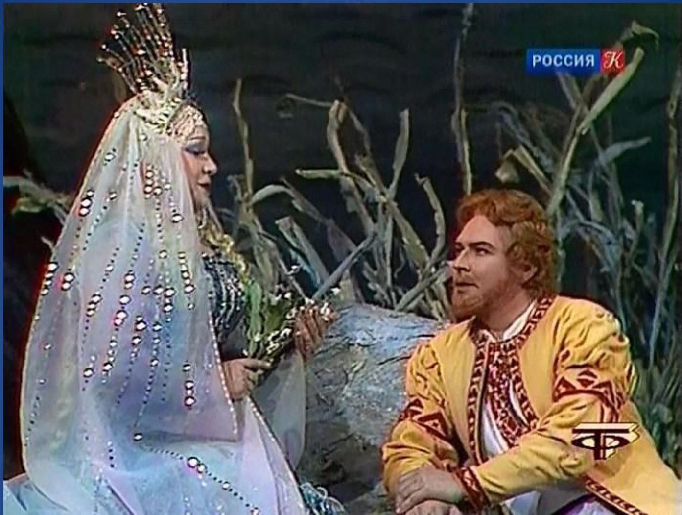
Царевна Волхова и Садко Сцена из оперы «Садко»