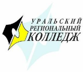
График учебного процесса