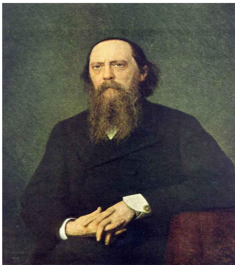
Михаилу Евграфовичу Салтыкову-Щедрину