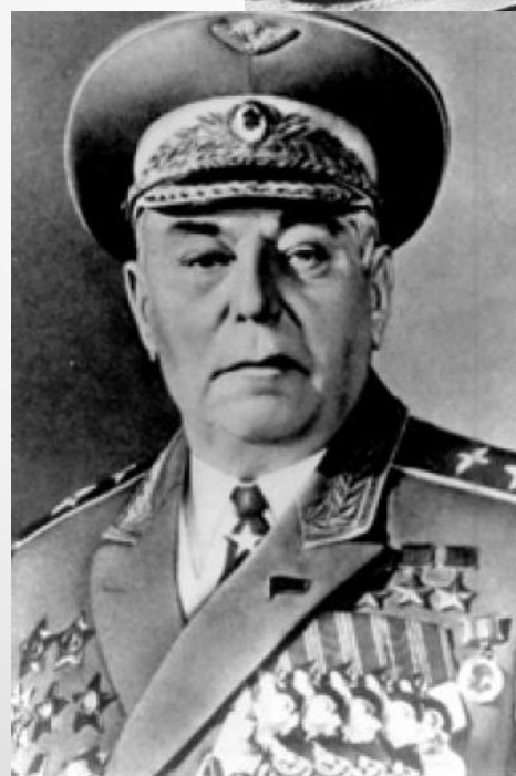
Александр Иванович Покрышкин (1913-1985) Советский летчик-ас, трижды герой Советского Союза