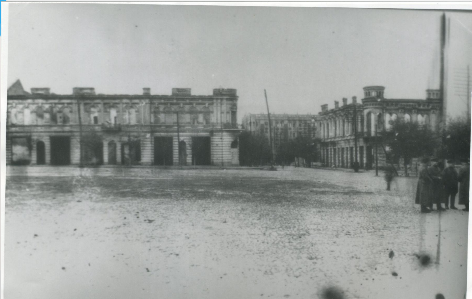
Площадь им. Ленина. На заднем плане руины дома союзов (сегодня – МТТ)