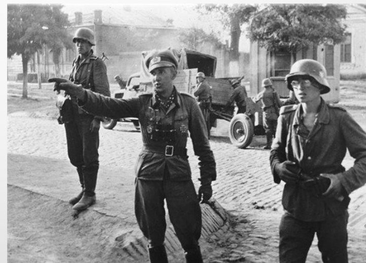
Оккупанты на одной из улиц Краснодара