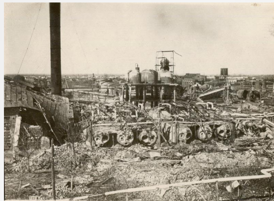
Краснодарский нефтеперегонный завод

По мере расширения восстановительных работ все острее ощущалась потребность в кадрах. В крае возобновили работу 11 ремесленных и железнодорожных училищ, 16 школ ФЗО с общим контингентом учащихся 7496 человек. К январю 1944 г. на Кубани было восстановлено и вступило в строй действующих 504 государственных предприятия и 326 промышленных артелей. В 1945 г. выпуск валовой промышленной продукции края составил одну треть довоенного уровня.