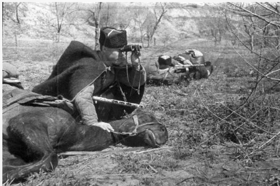
Кубанские казаки на фронтах Великой Отечественной войны

В состав корпуса вошел созданный в Адыгее кавалерийский полк. В начале 1942 г. 17-й Кубанский кавалерийский корпус был зачислен в кадровый состав Красной Армии.