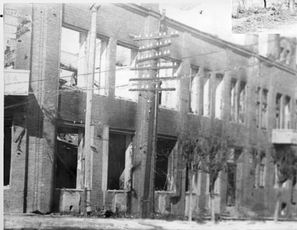
Ул. Кирова в Армавире