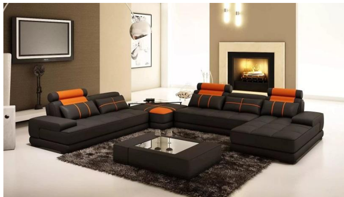
Современная мебель в интерьере.

При создании обстановки квартиры чаще всего приобретают мебель одного стиля – гарнитур. Но ансамбль может быть создан из разнородных по стилю вещей: столов, стульев, который создает впечатление одного целого благодаря их форме, фактуре и цвету.