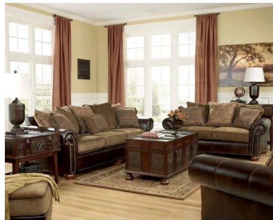
Антикварная мебель в интерьере.