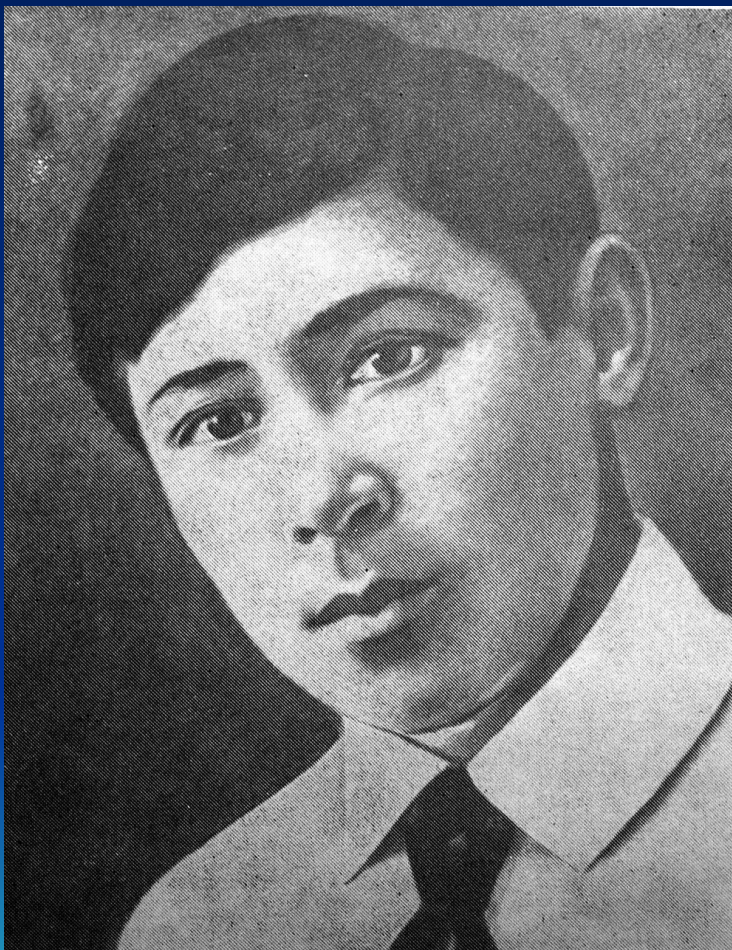
Муса Жәлил (1906 – 1944)