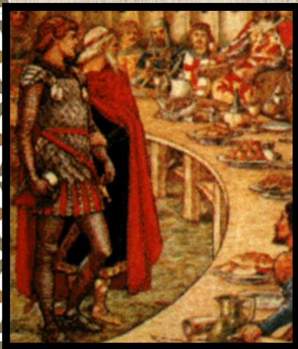
Король Артур и рыцари Круглого Стола

Ранняя история Англии известна по легендам о Короле Артуре.