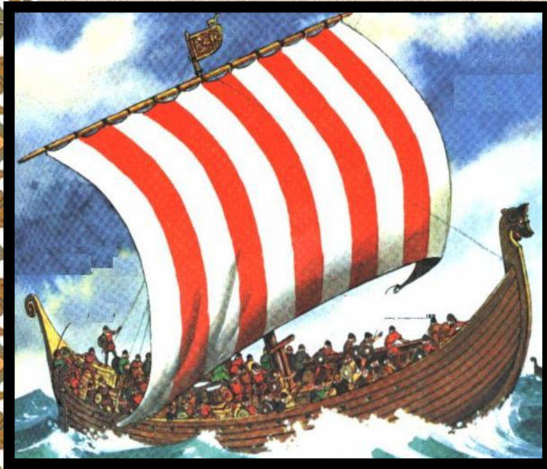
Драккар-боевой корабль викингов

Норманы обрушивались на поселения уничтожая всех на своем пути, или захватывали пленников.