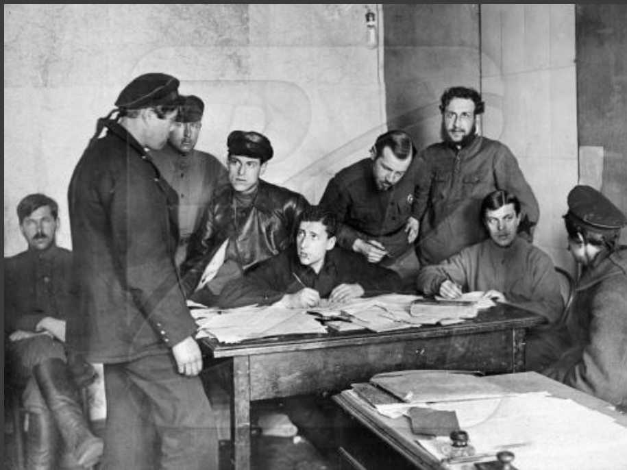
Воззвание Кронштадтского гарнизона