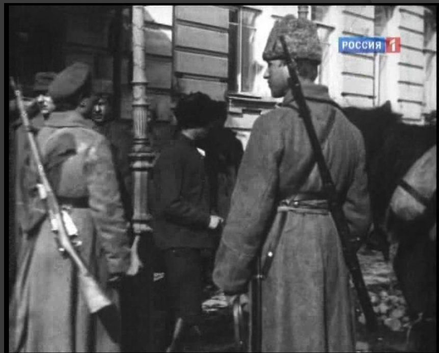
«Власть Советам, а не партиям!»