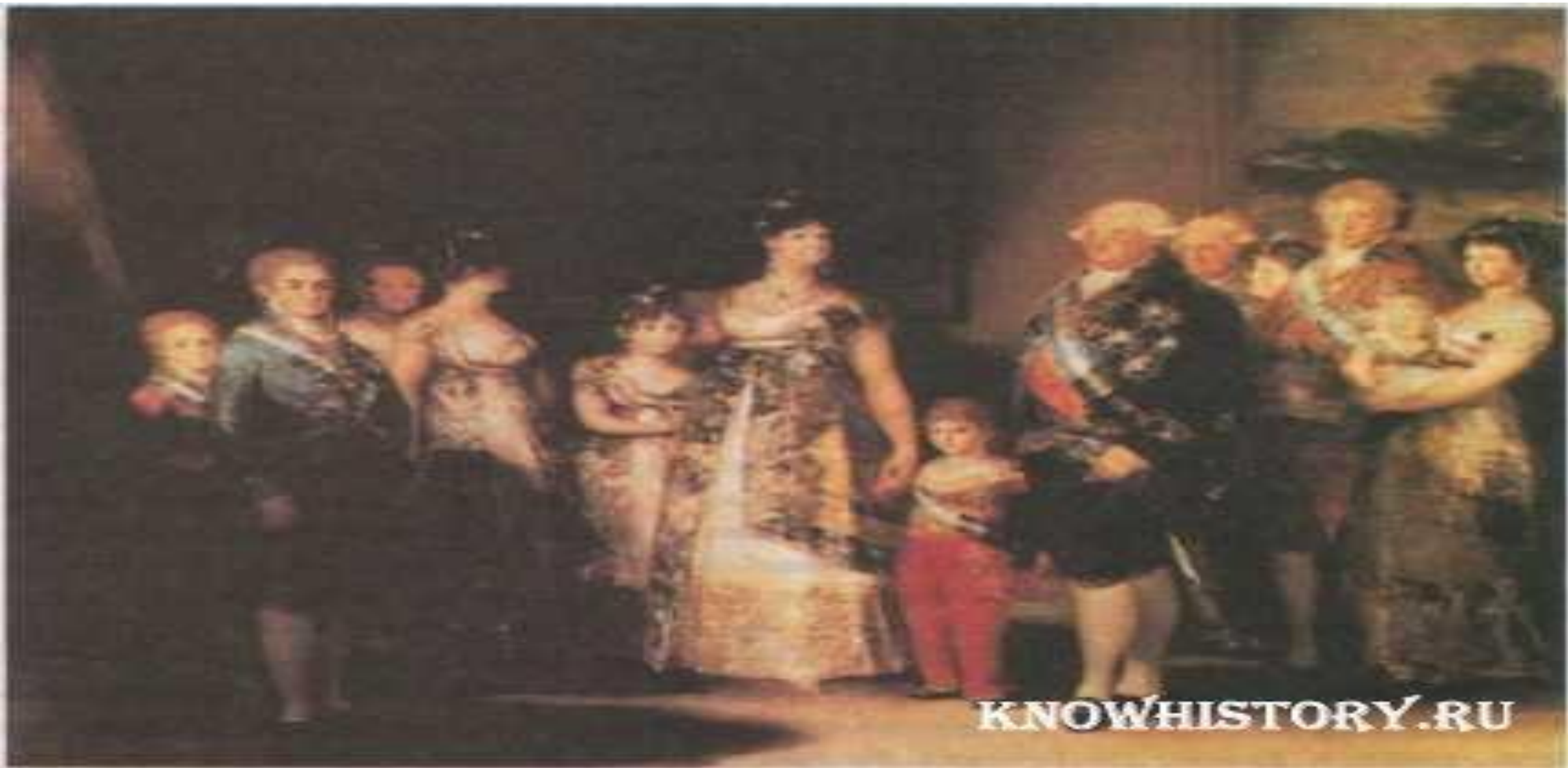
Карл IV и его семья. Ф. Гойя. Слева (в тени) художник изобразил самого себя