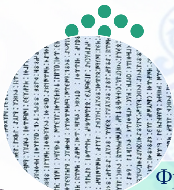
Фрагмент текста памятника Кюльтегину. Западная сторона

«Тот, кто надписал все надписи — я, (принц) Йоллыг тегин, племянник Кюльтегина. Сев двадцать дней Я, (принц) Йоллугтегин, написал все эти надписи на этом камне. Для сыновей и родственников, чтобы оплакивать. Благословите.....»